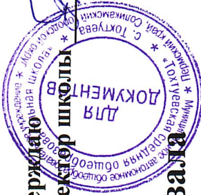
График Проведения уборки обеденного зала с использованием дезинфицирующих средств